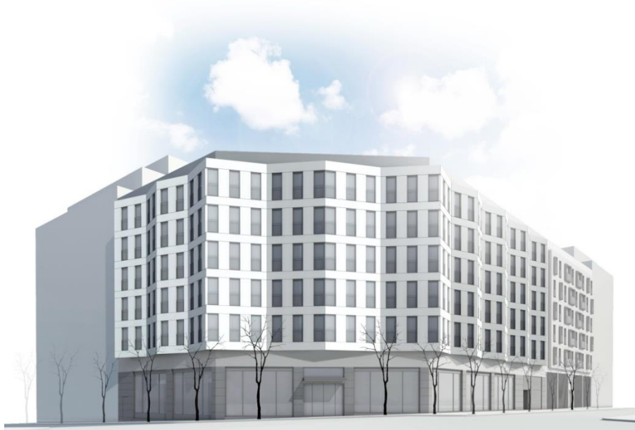
Hotel Barcelona 1882

Certificació LEED® - Líder en Eficiència Energètica i Disseny sostenible, Sistema de Certificació d'Edificis Sostenibles. LEED® es una marca registrada de l' U.S. Green Building Council .