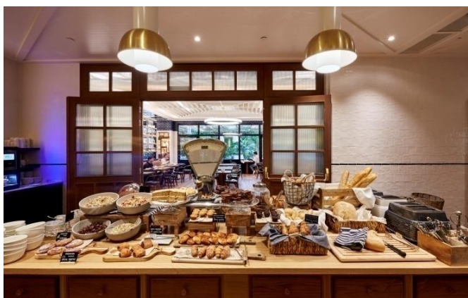
Hotel Barcelona 1882

La II Jornada Hotel Barcelona 1882 tindrà lloc el 14 de Febrer en el mateix Hotel, el primer a la Península Ibèrica en aconseguir el Certificat LEED® Gold . El objectiu de la Jornada es conèixer els beneficis econòmics i ambientals aconseguits després d'un any de funcionament , amb dades reals de consums. Així com exposar, difondre i aportar una visió global, innovadora i de avantguarda sobre el desafiament mediambiental de la Construcció Sostenible , l' Economia Circular i la cura del Medi ambient . Els temes de la conferència a tractar estan basats en sectors considerats clau i d'especial importància per la nostra economia actual i de futur: Turisme Sostenible, Economia Circular, Construcció Sostenible i Eco Mobilitat .