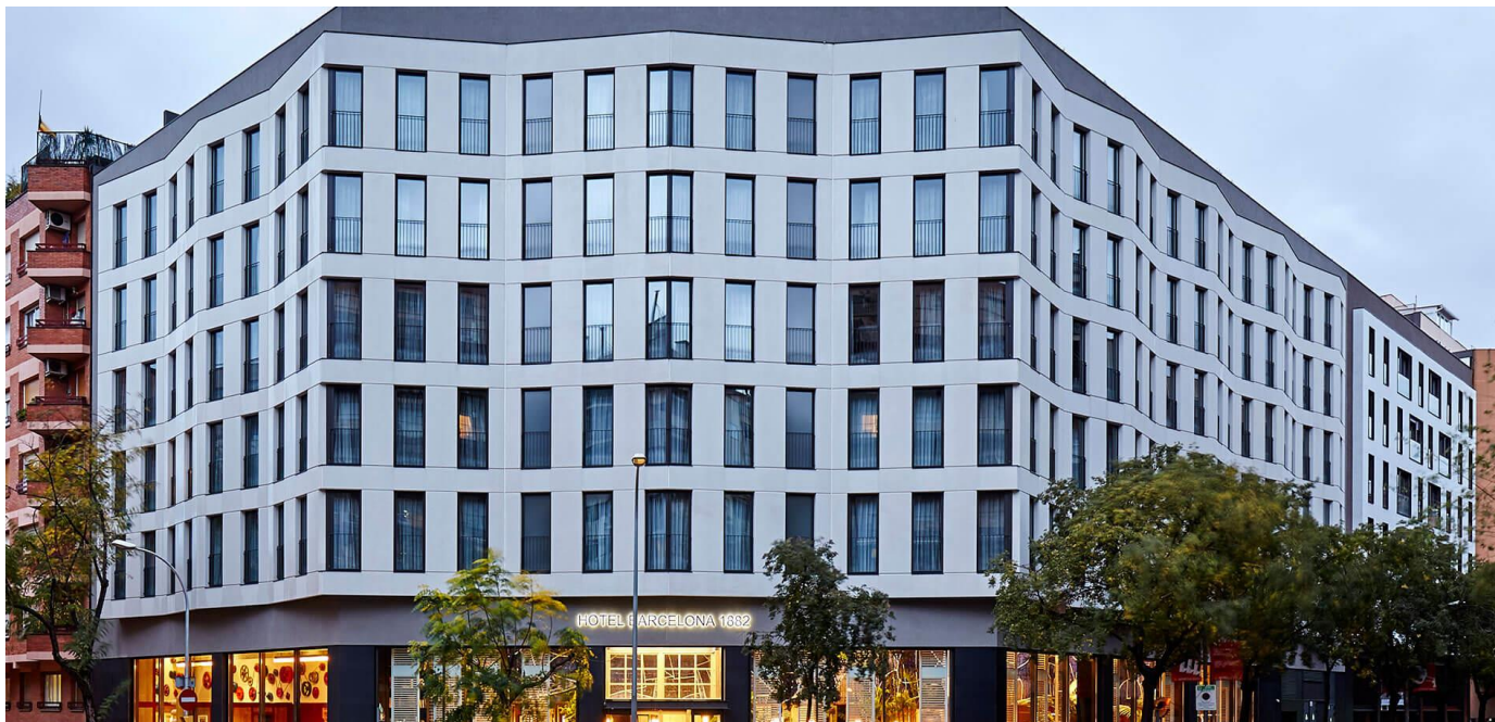
Hotel Barcelona 1882

La II Jornada Hotel Barcelona 1882 tindrà lloc el 14 de Febrer en el mateix Hotel, el primer a la Península Ibèrica en aconseguir el Certificat LEED® Gold . El objectiu de la Jornada es conèixer els beneficis econòmics i ambientals aconseguits després d'un any de funcionament , amb dades reals de consums. Així com exposar, difondre i aportar una visió global, innovadora i de avantguarda sobre el desafiament mediambiental de la Construcció Sostenible , l' Economia Circular i la cura del Medi ambient . Els temes de la conferència a tractar estan basats en sectors considerats clau i d'especial importància per la nostra economia actual i de futur: Turisme Sostenible, Economia Circular, Construcció Sostenible i Eco Mobilitat .