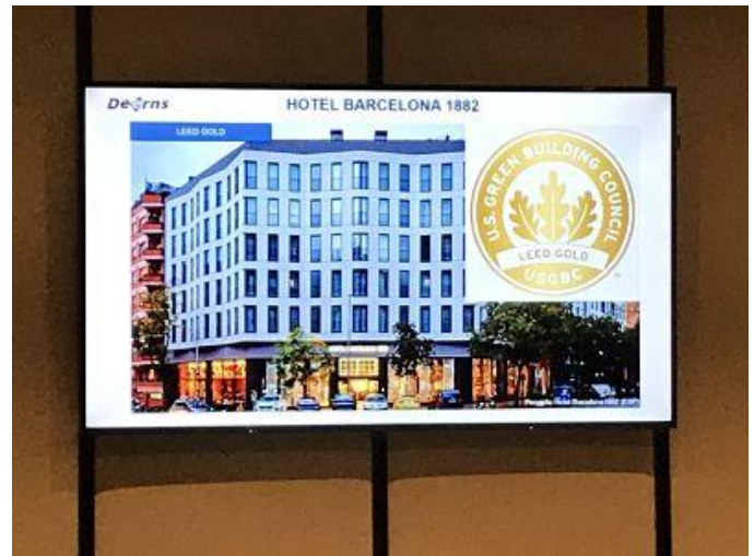
Hotel Barcelona 1882, primer Hotel LEED Gold en la Península

L'Hotel Barcelona 1882 ha aconseguit el segell LEED Gold, obtenint un elevat estalvi en aigua (4.448 m3/any comparat amb un altre hotel equivalent); produint 357 Mwh de energia (disposa de panells solars tèrmics i sistema VRV amb recuperació de calor, per a la generació de l'aigua calenta sanitària); estalvi en il·luminació de 98 Mwh; etc. El proper repte per al hotel serà obtenir el certificat WELL, Smart Buildings centrats en la salut i el benestar de les persones.