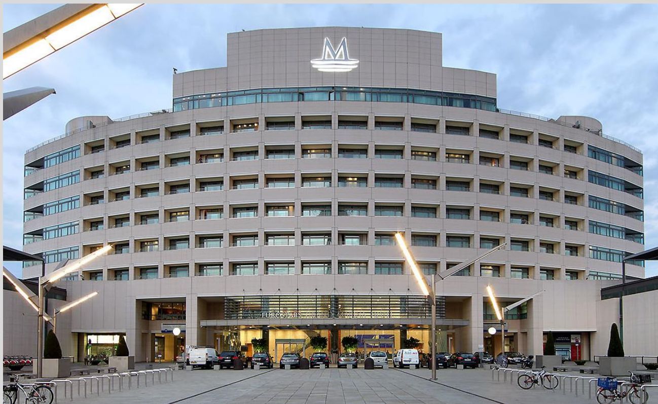
Hotel Eurostars Grand Marina World Trade Center (Barcelona), certificat BREEAM ES En Ús

La metodologia BIM (Building Information Modeling) integrant els estàndards de sostenibilitat BREEAM®